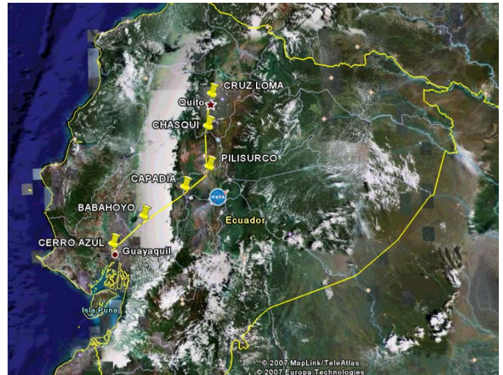
Figura. 2 Ruta Actual

que comunica las ciudades de Quito y Guayaquil y tiene el siguiente recorrido: Cerro Cruz Loma - Cerro Chasqui - Cerro Pilisurco - Cerro Capadia - Babahoyo y Cerro Azul 1. Esta ruta es la que se muestra en la Figura. 2.