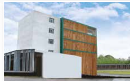
SEDE SANTO DOMINGO