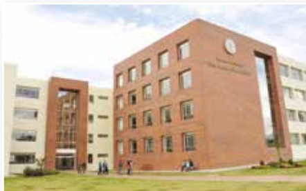
SEDE LATACUNGA - CAMPUS GRAL. GUILLERMO RODRÍGUEZ LARA