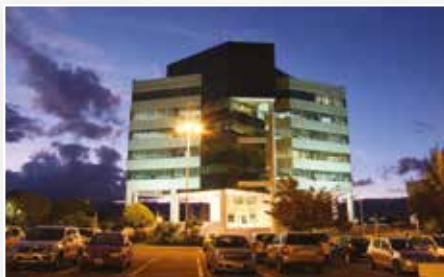
SEDE MATRIZ - SANGOLQUÍ